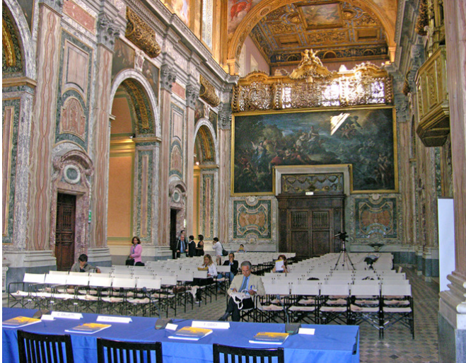
Complesso dei SS. Marcellino e Festo