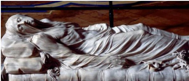
Il Cristo Velato nella Cappella S. Severo