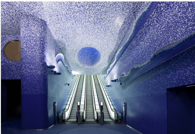
Stazione Toledo della linea 1 della Metropolitana