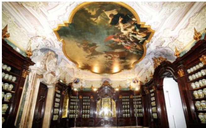
Farmacia degli Incurabili