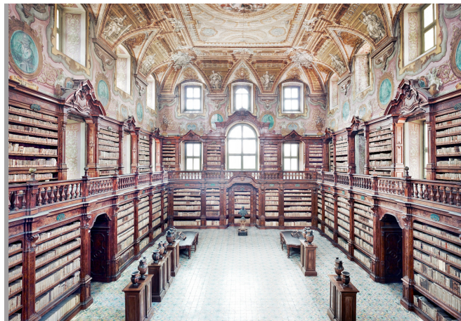
Biblioteca dei Girolamini